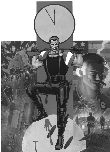
Abb. 1: Comedian