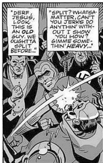
Abb. 3: Nite Owls punch

bombe (Stevens, 2015: 63) und wird sogar mit Bomben in der Hand abgebildet (Cunningham, 2009: 179). In Watchmen wird auf der bildlichen Ebene ebenfalls explizit auf die Atombombenabwürfe auf Hiroshima und Nagasaki verwiesen. Es sind mehrmals in der Graphic Novel Graffiti an Hauswänden abgebildet, die zwei Menschen in schwarzer Farbe zeigen. Eine Nebenfigur kommentiert diese Graffiti damit, dass sie an die Opfer von Hiroshima erinnern, von denen nur noch Schatten zurückblieben (W: 194). Damit spielt die Figur auf bekannte Fotografien an, die zeigen, wie nach den Atombombenabwürfen nur noch verkohlte Leichen zurückblieben (Anonym 2010).