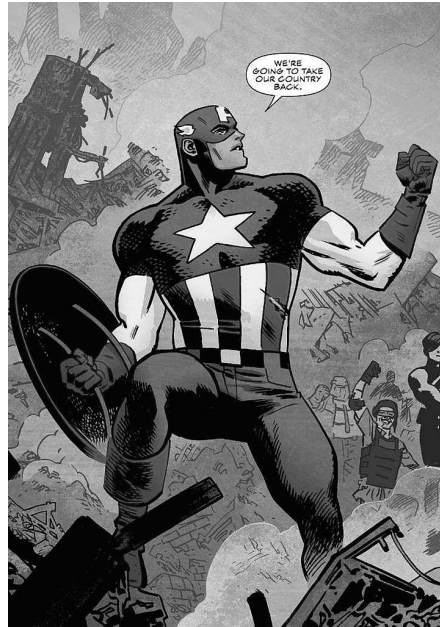
Abb. 2: Captain America

(W: 129), wie es auch in dieser Abbildung angedeutet ist. Auch wenn Captain America dem Töten nicht abgeneigt ist, wird er jedoch nicht lachend gezeigt, wenn er jemanden erschießt (Cunningham, 2009: 181).